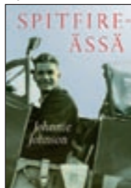
SPITFIRE-ÄSSÄ Johnnie Johnsson oli RAF:n paras hävittäjälentäjä 280 siv. Hinta 28,-

Meillä on Suomen suurin valikoima ilmailukirjoja. Myös valtava määrä muuta Military-kirjallisuutta.