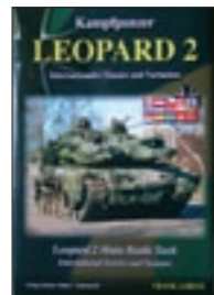
LEOPARD 2 750 valokuvaa Leopardista vientimaissa. 296 siv. Kovak. Engl.kielinen. Hinta 49,-