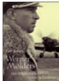
WERNER MÖLDERS Hävittäjälentäjän elämä ja kuolema 448 siv. Hinta 35,-