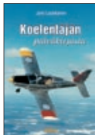
KOELENTÄJÄN PÄIVÄKIRJASTA Jyrki Laukkasen lentämät koneet. 208 siv. Hinta 46,-