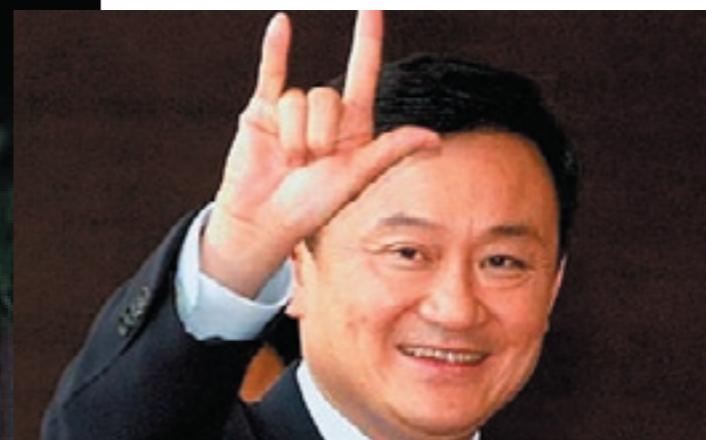
Thaksin Sinawatra, Thaimaan entinen pääministeri.

Pääministeri Abhisit Vejjajivan ja hänen hallintonsa tulevaisuus näyttää sis kaikkea muuta kuin turvatulta. Thaimaalla ja erityisesti Bangkokilla voi hyvinkin olla edessä ennenaikaiset vaalit ja uusien poliittisten levottomuuksien täyttämiä jaksoja matkalla niihin.